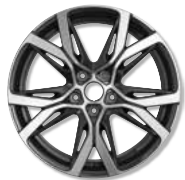
18"-Leichtmetallräder Sérac, glanzgedreht