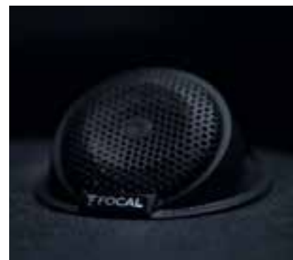
Zwei invertierte Kalottenhohtöner