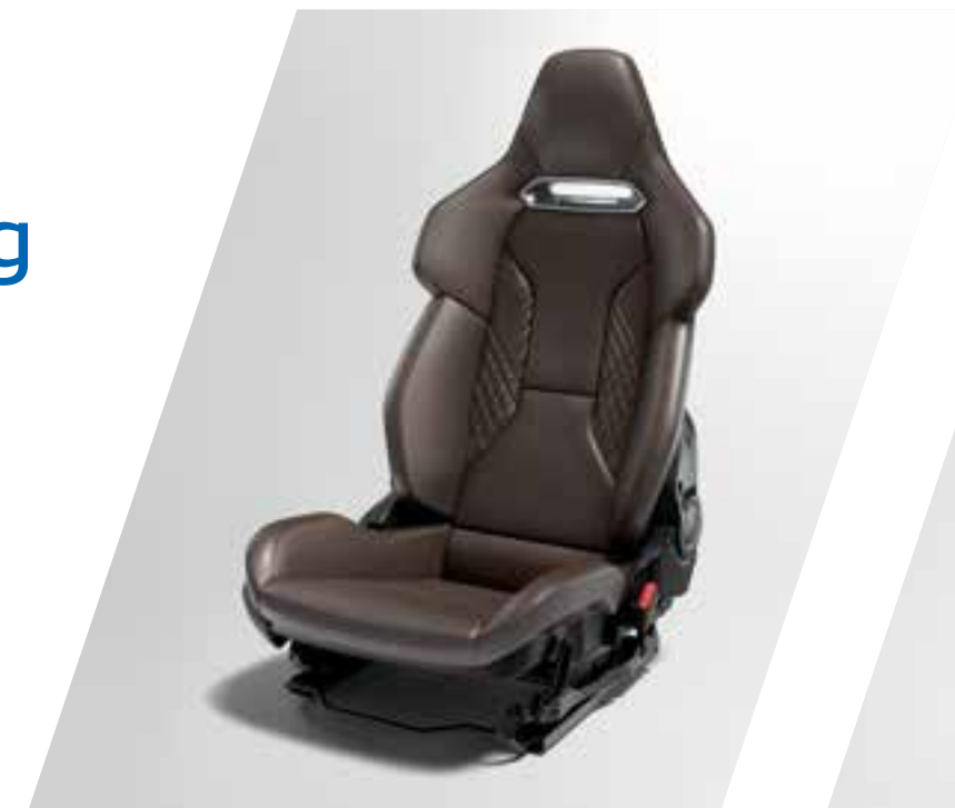
Sechsfach einstellbare Komfortsitze von Sabelt