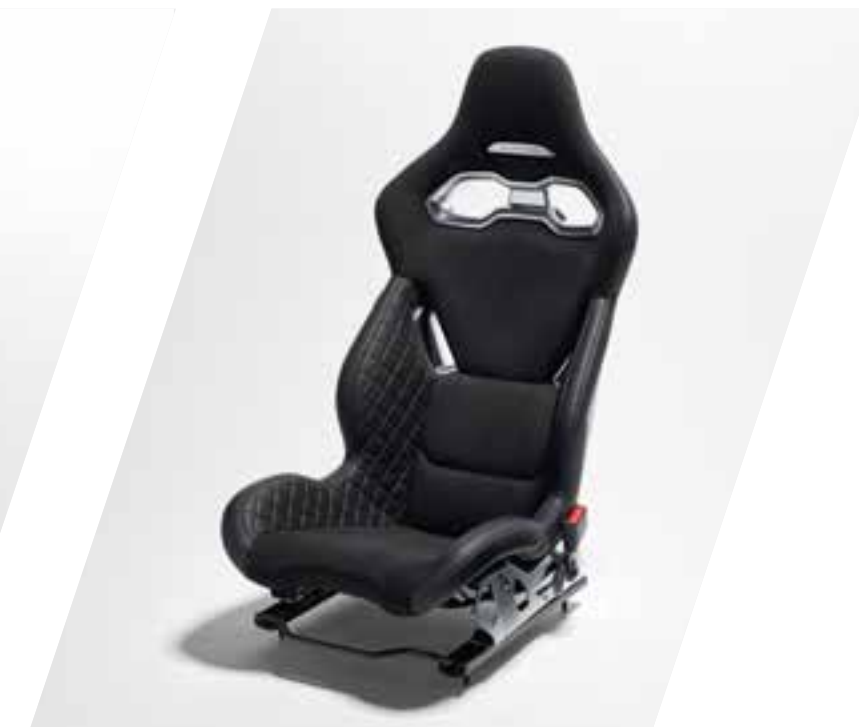
Leichte Sabelt-Rennsitze aus schwarzem Leder und Mikrofaser