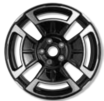
18"-Leichtmetallräder Légende, diamantschwarz lackiert und glanzgedreht