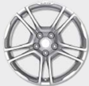
18"-Leichtmetallräder von Fuchs, geschmiedet

18"-Leichtmetallräder von Fuchs für mehr Kraft und weniger Gewicht Die geschmiedeten 18"-Leichtmetallräder von Otto Fuchs sorgen für mehr Kraft und weniger Gewicht. Sie verbessern damit Fahrspass und Agilität der A110 noch einmal.